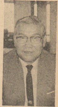
中村勇一 吹田市教育長

二、公教育は計画、指導、評価の一貫性を必要とする。したがって、「なまなましい生きざまをじかに子どもにぶつける」な