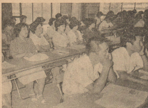
教育人材銀行について熱心に聴き入る お母さんたち（シンポジウムで）

れます。そんなカタいこといわんと、子ども本位に考えてみたらどうかと思いますね。なにも教科書のページ数をこなすのが教育とは違いますやろ」と、市教委の姿勢に首をかしげるばかり。