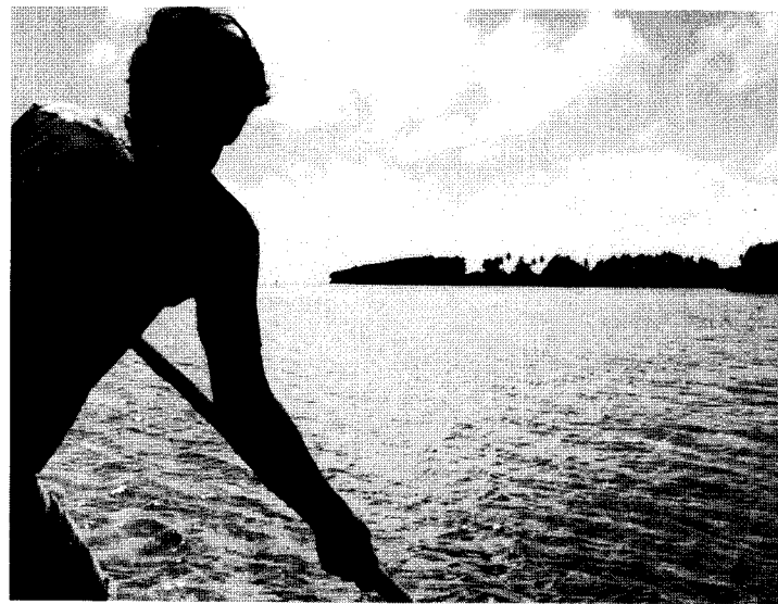
ナンマドールの遠景

同行していたカメラマンのO記者が、部屋に飛び込んできた。あわてて飛び起きると、新郎新婦は教会で式を終え、村に帰る途中。後を追った。披露宴が催される村の集会所には八方から女たちがダンボール箱や