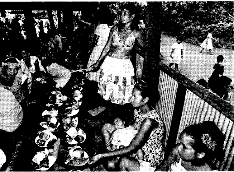
ボンベイの結婚式。料理をみんな持ち寄って、大にぎわいだ。

てない。「昔のナンマルキは妻を二、三人持てたが、いまはダメ。みんなクリスチャンになったためです。ナンマルキの仕事も警察、裁判所が肩代りするようになった」とリヤンテルさんはいっていた。