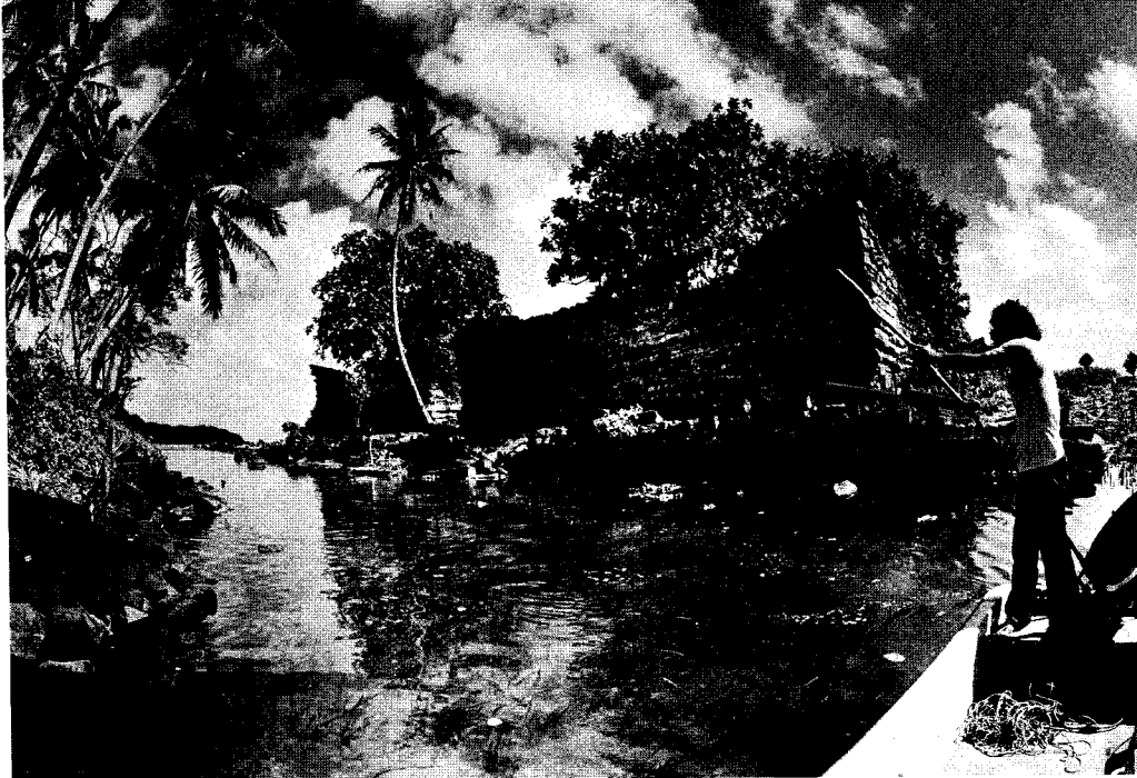
海上にある巨大遺跡、ナンマドールの神殿。いつ、だれが造ったのか、ナゾのまま。